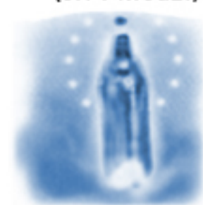
Ukoronowanie Najświętszej Maryi Panny