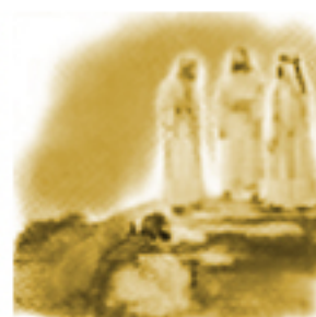
Przemienienie na górze Tabor