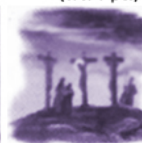
Śmierć Pana Jezusa na krzyżu