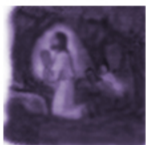
Modlitwa Pana Jezusa w Ogrójcu