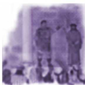
Cierniem ukorowanie Pana Jezusa