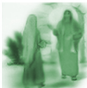
Nawiedzenie świętej Elżbiety