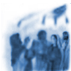
Zesłanie Ducha Świętego