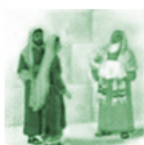
Ofiarowanie Pana Jezusa w świątyni