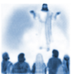
Wniebowstąpienie Pana Jezusa