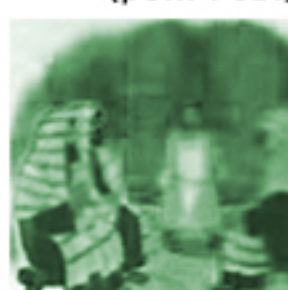
Odnalezienie Pana Jezusa w świątyni