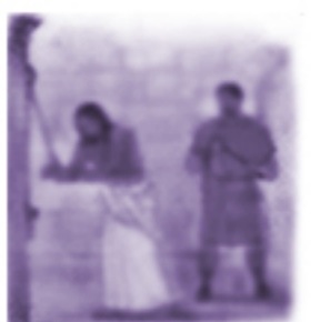
Biczowanie Pana Jezusa