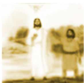
Chrzest Pana Jezusa w Jordanie