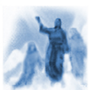
Wniebowzięcie Najświętszej Maryi Panny