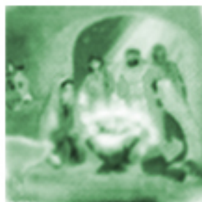
Narodzenie Pana Jezusa