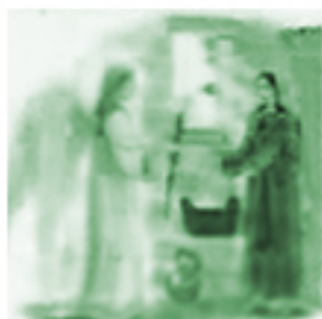
Zwiastowanie Najświętszej Maryi Pannie