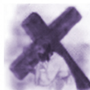
Droga Krzyżowa Dźwiganie krzyża