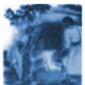
Zmarwychwstanie Pana Jezusa