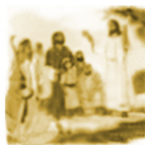
Głoszenie Królestwa Bożego i wzywanie do nawrócenia