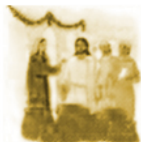
Objawienie się Pana Jezusa na weselu